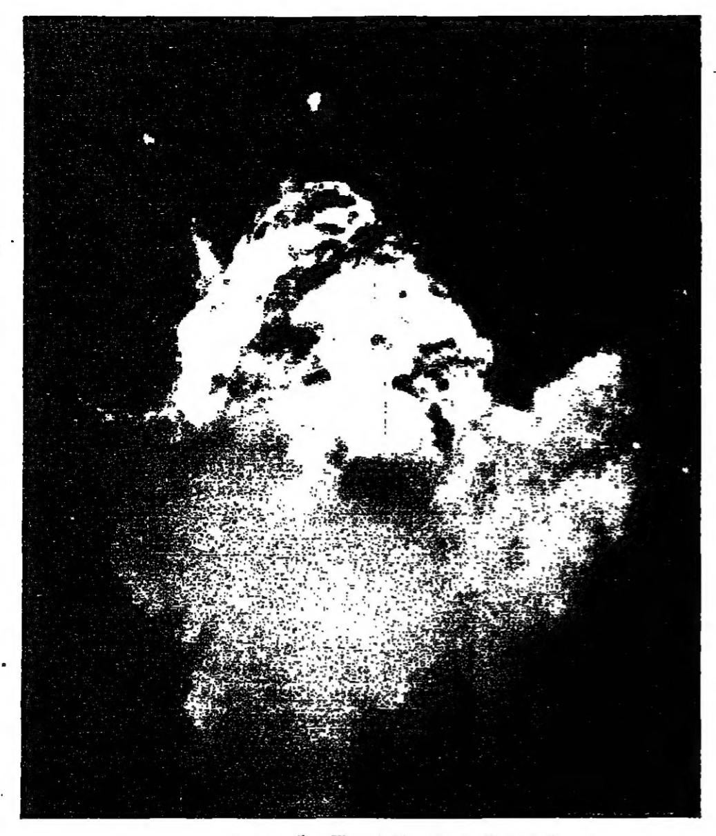
الصاروخ الاجري لدى انفجاره بالبحر الاوربي

في حال وقوعه في حادثة، قد يكون سببا في خسارة بعض الزمان وتحولهم نحو الشهرة العالمية. لكن التأخير الزمني الناتج عن هذا الحادث، قد يكون سببا في خسارة بعض الزمان وتحولهم نحو الشهرة العالمية.